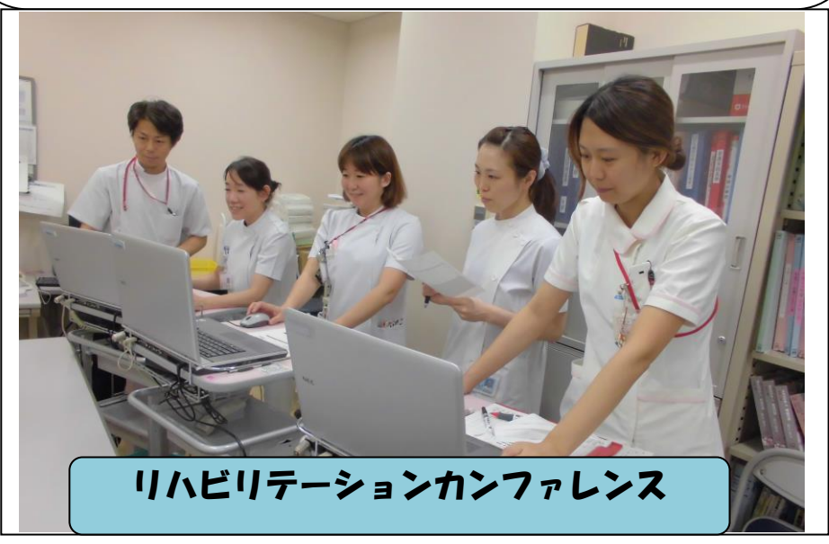
リハビリテーションカンファレンス

整形外科カンファレンス 整形外科部長の兵藤先生を中心に、治療方針の確認・退院までのスケジュールの調整などを行っています。