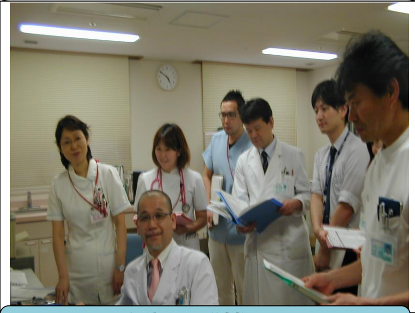
大腿骨地域連携パスカンファレンス

高齢者の方が多く入院しているため、住み慣れたお家へ早期に退院できるように話し合いをしています。リハビリテーション科と病棟看護師、ケースワーカーや医師が情報を持ち寄って話し合いを行っています。